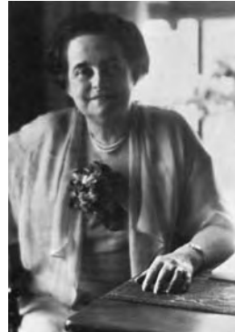
Alice A. Bailey

En la época actual, la mayor expresión de esta enseñanza fue dada a través de Helena Petrovna Blavatsky, una de las fundadoras de la Sociedad Teosófica, entre 1875 y 1890. Su libro La Doctrina Secreta es la fase preparatoria de las enseñanzas dadas para el nuevo