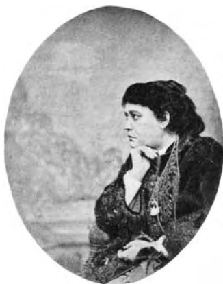
Helena Petrovna Blavatsky

alma, no hay sexo, ni femenino ni masculino. Hay simplemente una energía con dos polos: uno positivo, uno negativo, como en la electricidad. Son la misma energía en polaridad. Los Maestros son almas perfeccionadas, así que han conseguido que las dos estén en equilibrio, pero cuando Ellos toman un cuerpo físico (no todos lo hacen; unos dos tercios de los Maestros en la actualidad, es decir unos 40, están en cuerpos físicos densos), toman un cuerpo