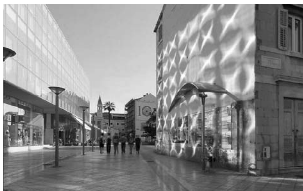
Patrones de luz en un edificio del centro de Split, Croacia