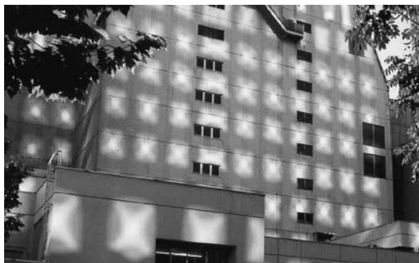
Patrones de luz en los Almacenes Tokyu en Sapporo, Hokkaido, Japón