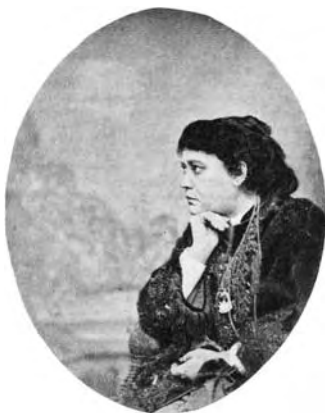
Helena Petrovna Blavatsky

alma, no hay sexo, ni femenino ni masculino. Hay simplemente una energía con dos polos: uno positivo, uno negativo, como en la electricidad. Son la misma energía en polaridad. Los Maestros son almas perfeccionadas, así que han conseguido que las dos estén en equilibrio, pero cuando Ellos toman un cuerpo físico (no todos lo hacen; unos dos tercios de los Maestros en la actualidad, es decir unos 40, están en cuerpos físicos densos), toman un cuerpo