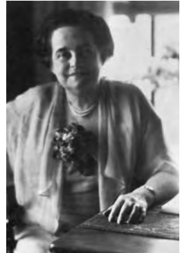
Alice A. Bailey

En la época actual, la mayor expresión de esta enseñanza fue dada a través de Helena Petrovna Blavatsky, una de las fundadoras de la Sociedad Teosófica, entre 1875 y 1890. Su libro La Doctrina Secreta es la fase preparatoria de las enseñanzas dadas para el nuevo