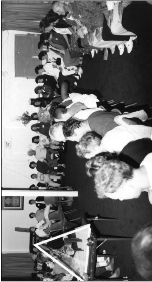
Cuando Benjamin Creme está presente, la Transmisión se convierte en un aduibramiento del Cristo, y el grupo se sujeta las manos.